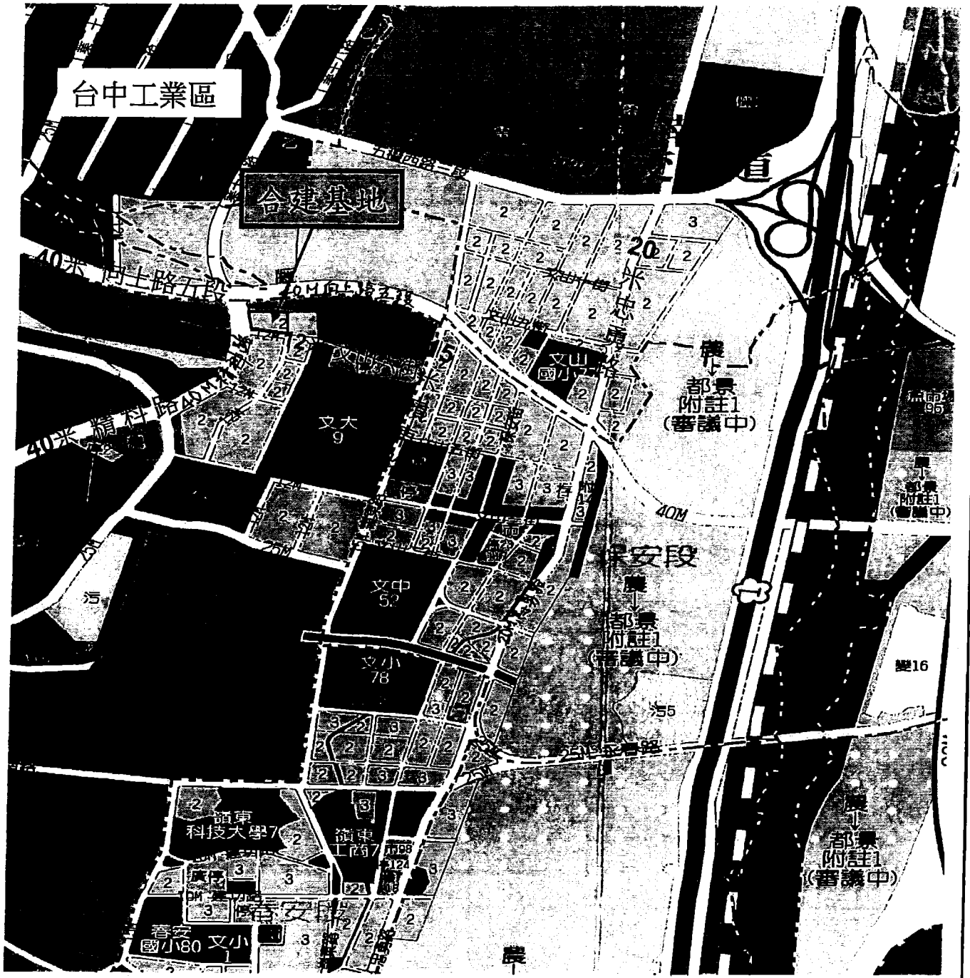
台中市南屯區寶文段35-2地號基地位置圖